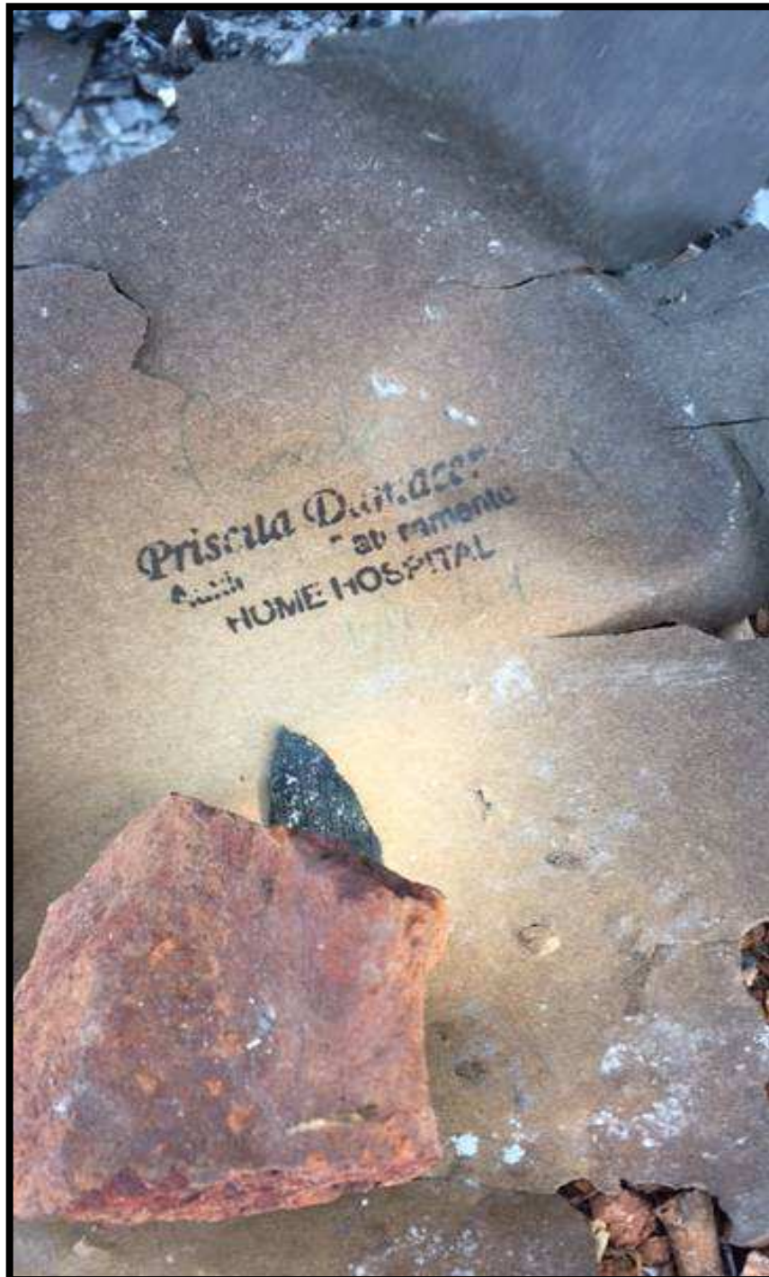
Documento com carimbo de Priscila Damaceno - Gerente de Faturamento do Hospital HOME