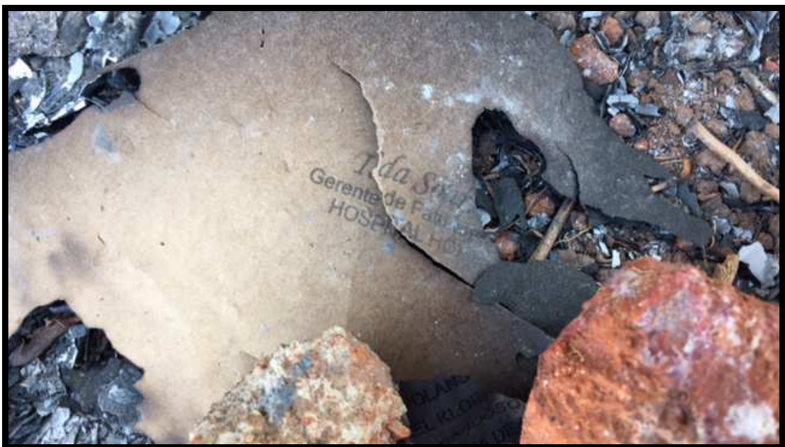
Documento com carimbo de Ieda Soares - Gerente de Faturamento do Hospital HOME

Segunda as investigações e após o recebimento de informações, agentes e peritos da Polícia Civil do DF dirigiram-se ao local onde os documentos haviam sido destruídos e ainda localizaram fragmentos de papéis queimados com o nome de funcionários do HOME e dados envolvendo aquele hospital (além de mídias e pen drives ), tudo devidamente fotografado e também relacionado em Laudo Pericial: