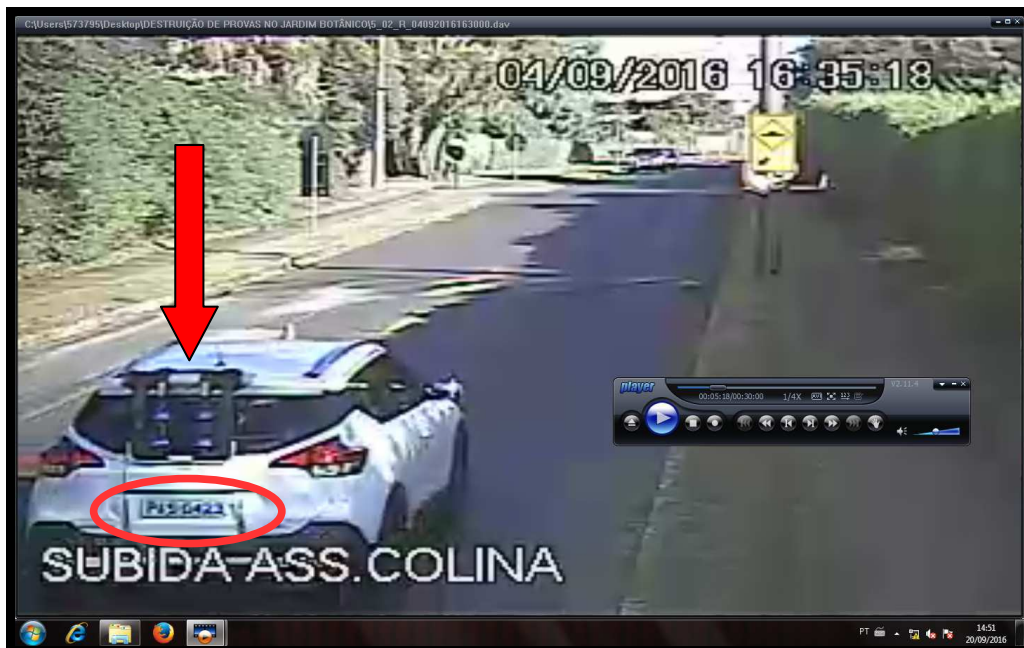
Identificação da placa e o suporte utilizado para transportar bicicleta.