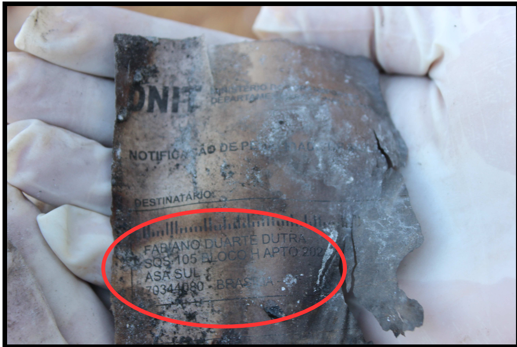
Restos de uma notificação onde FABIANO é o destinatário