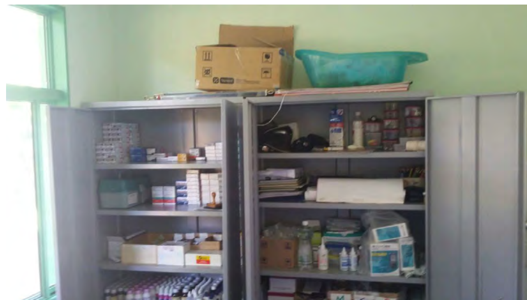
Foto: UBS Almecegas - Brazlândia