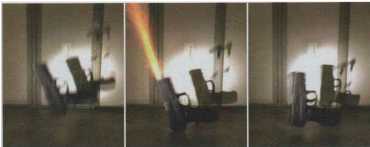
Excerto 01 - Três quadros subsequentes e justapostos (da esquerda para a direita) de um dos testes de segurança de queda em que ocorreu a detonação da espoleta.

Em conclusão, os peritos descreveram que a "arma está sujeita à ocorrência de disparos acidentais caso a câmara esteja alimentada."