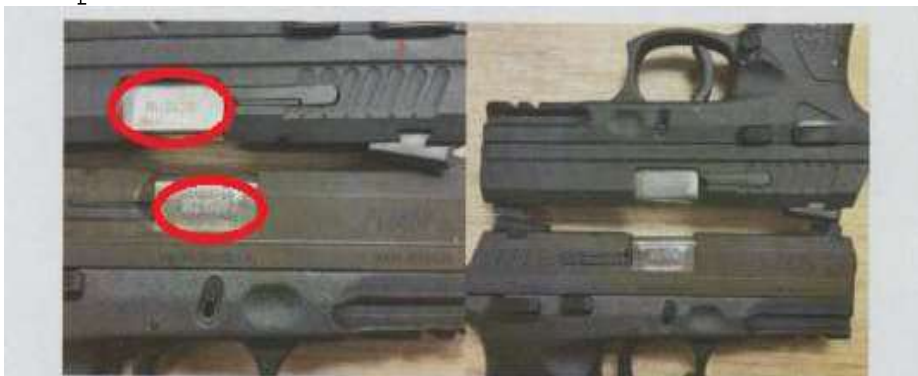
Figura: Deficiência no tratamento de resistência metálica e procedimento de "Teniferização"

90. (...) deficiência no tratamento de revestimento do armamento pois, mesmo em condição nova, sem uso, a nitrocarbonetação iônica em banho de sais (comercialmente chamada de Tenifer®), apresentou oxidação e possibilidade de ferrugem em dois exemplares: